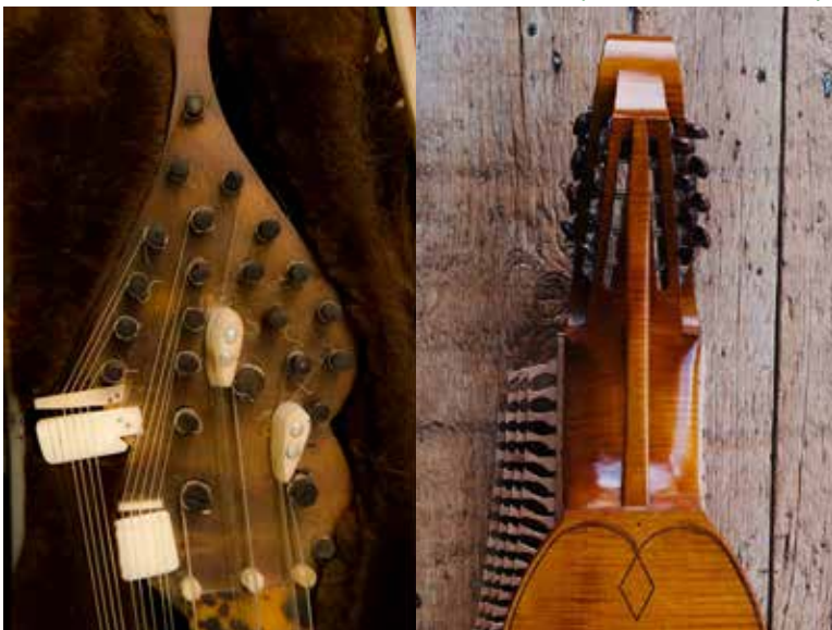
Lyra crétoise (gauche) et nyckelharpa (droite)